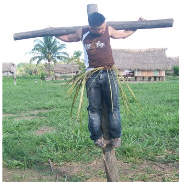
Realidad del Purús en imagen

Un joven rebosante de vitalidad, crucificado ! Aislado, huérfano