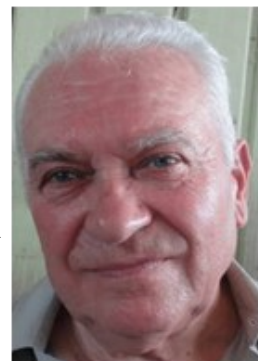
Excelentísimo ROMANO VOLPATO